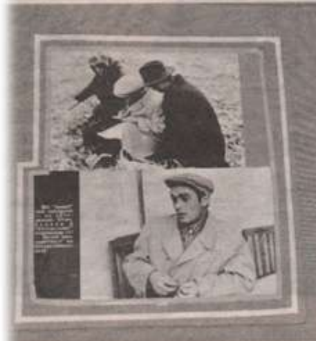
Фрагмент експозиції музею поета