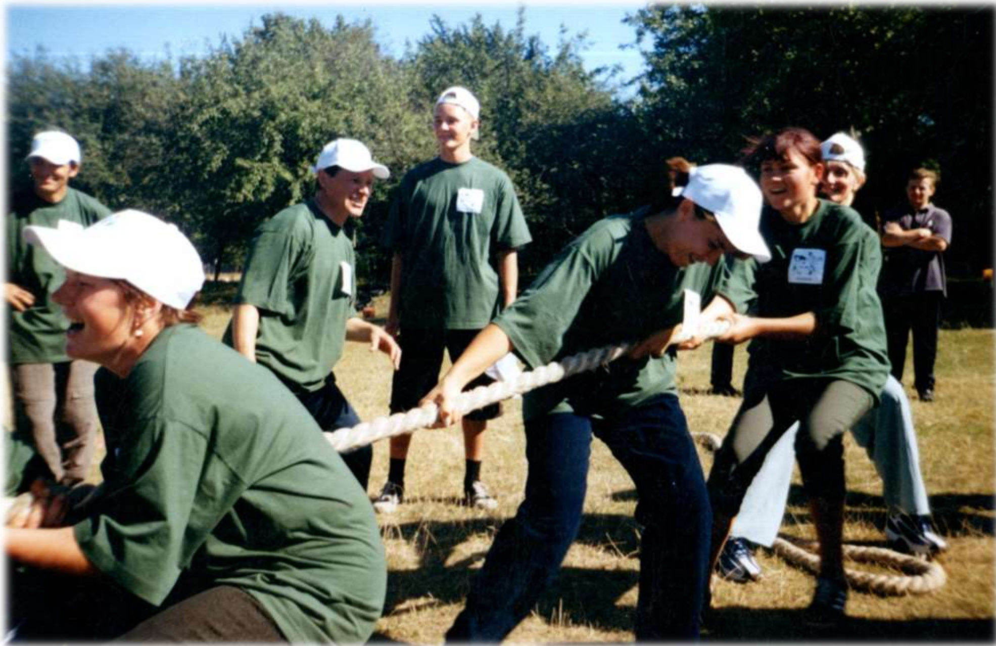
2010 р. На спортивному святі