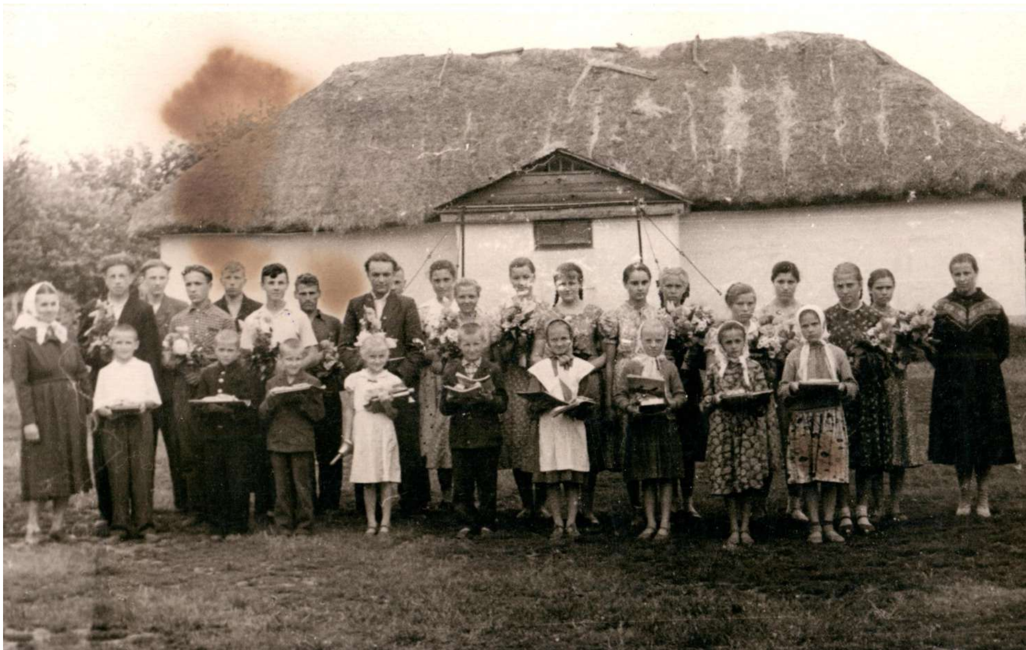
1959 р. Свято Першого дзвінка