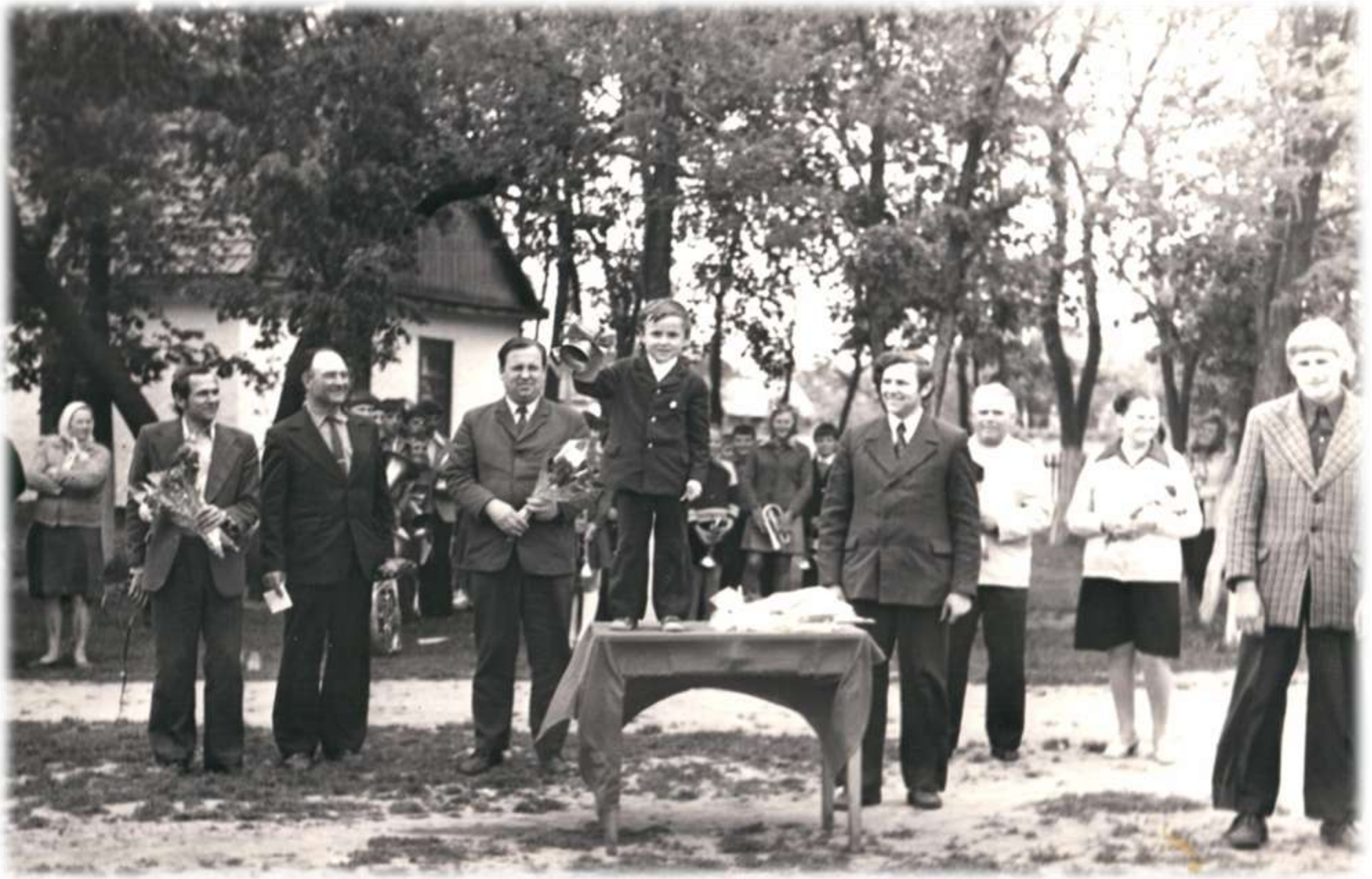
1977 р. Свято Першого дзвінка