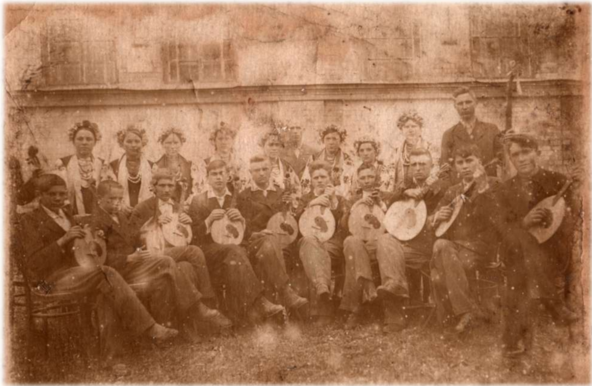
1 травня 1941 р. Музично-хоровий гурток Тарандинцівської середньої школи