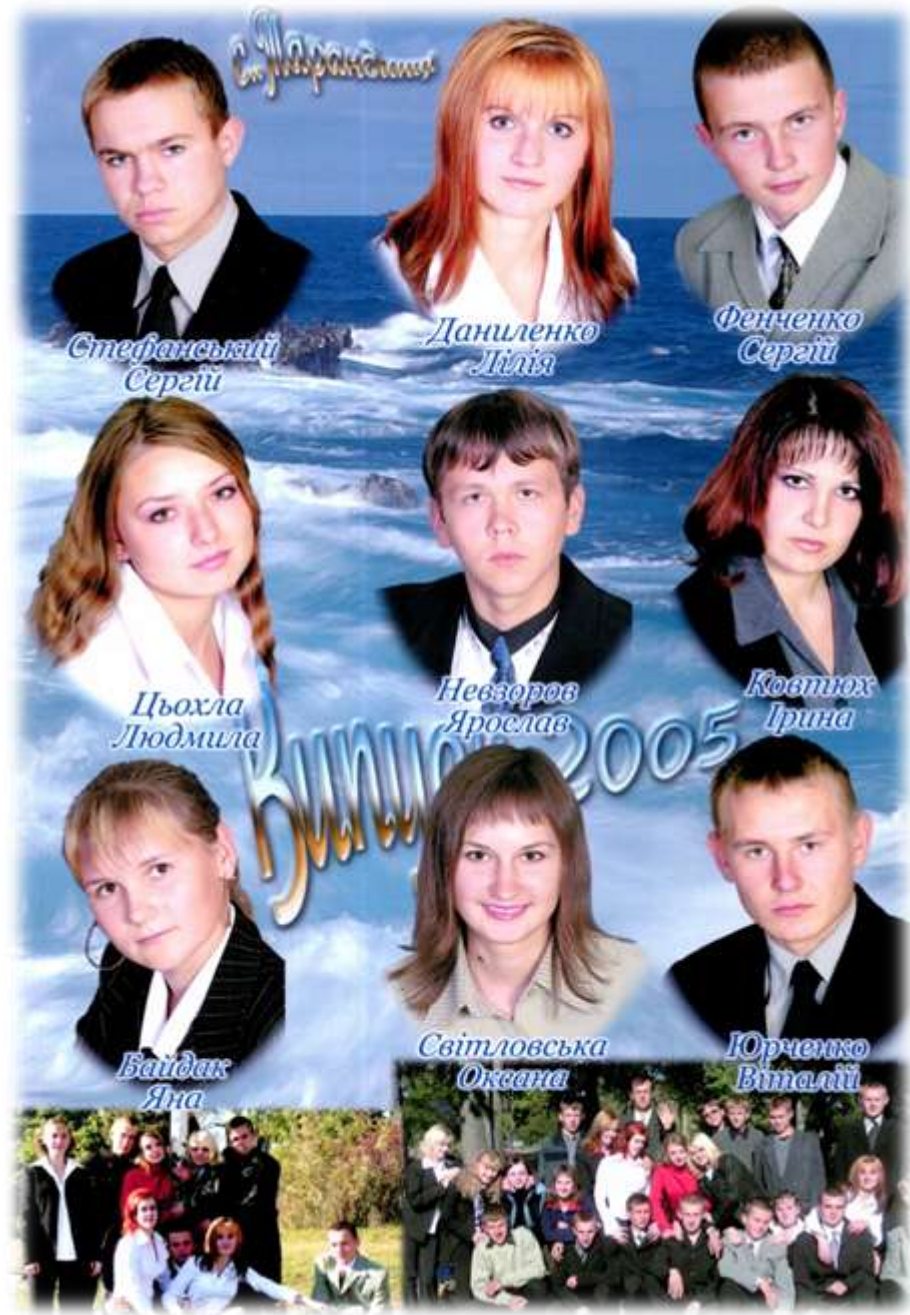
2005 р. Випускники школи