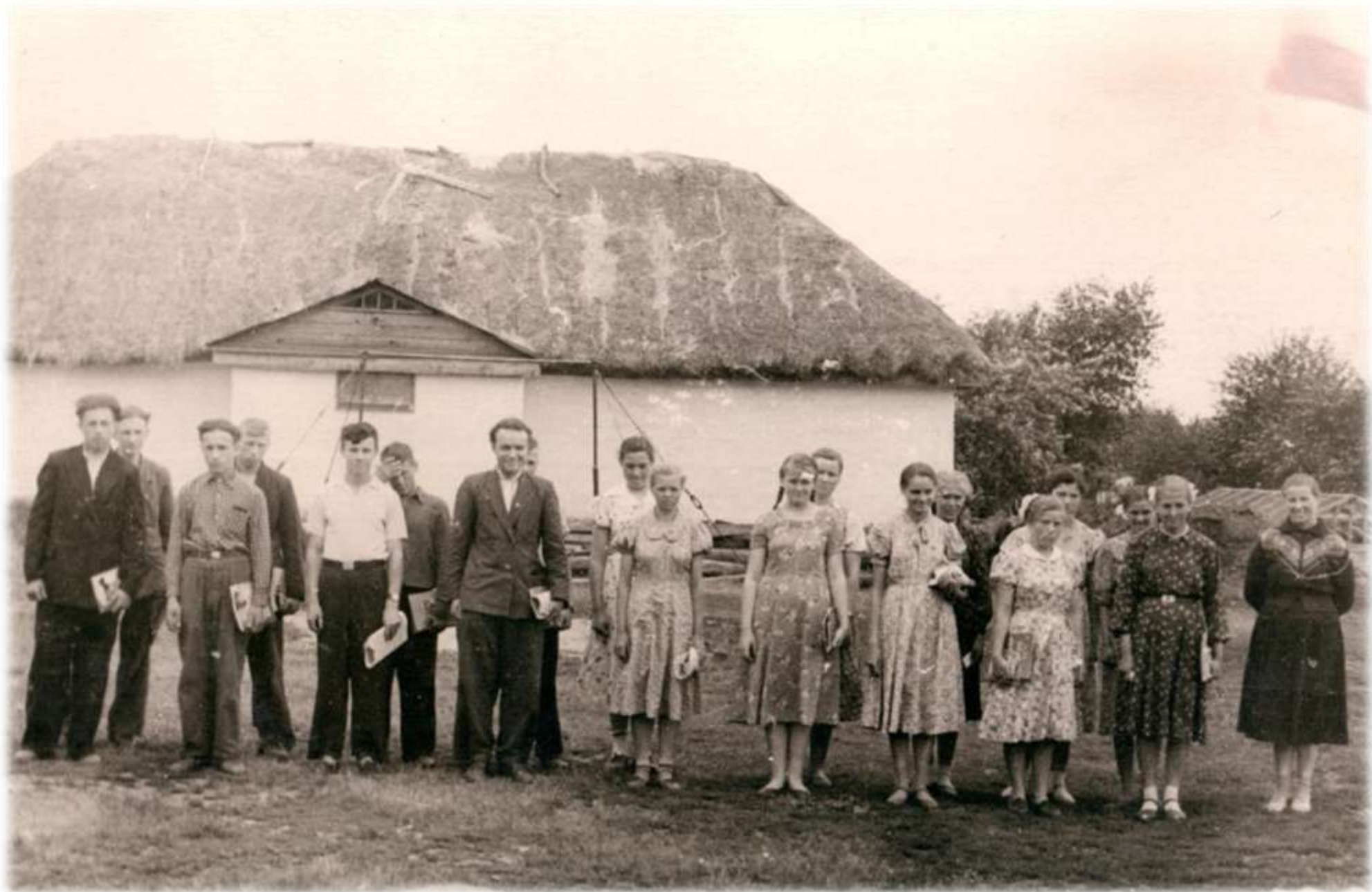
1962 р. Свято Останнього дзвінка