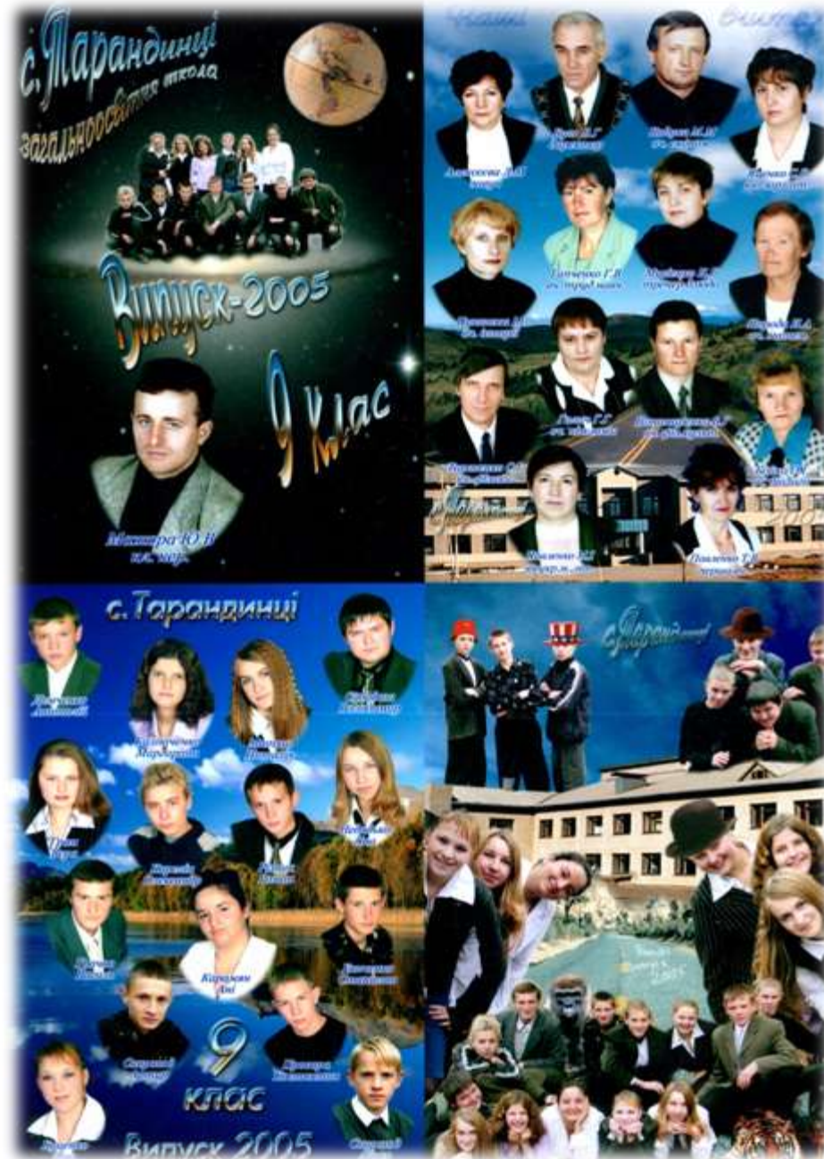
2005 р. Випускники школи