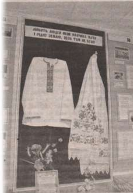
Серед експонатів — полтова соронка