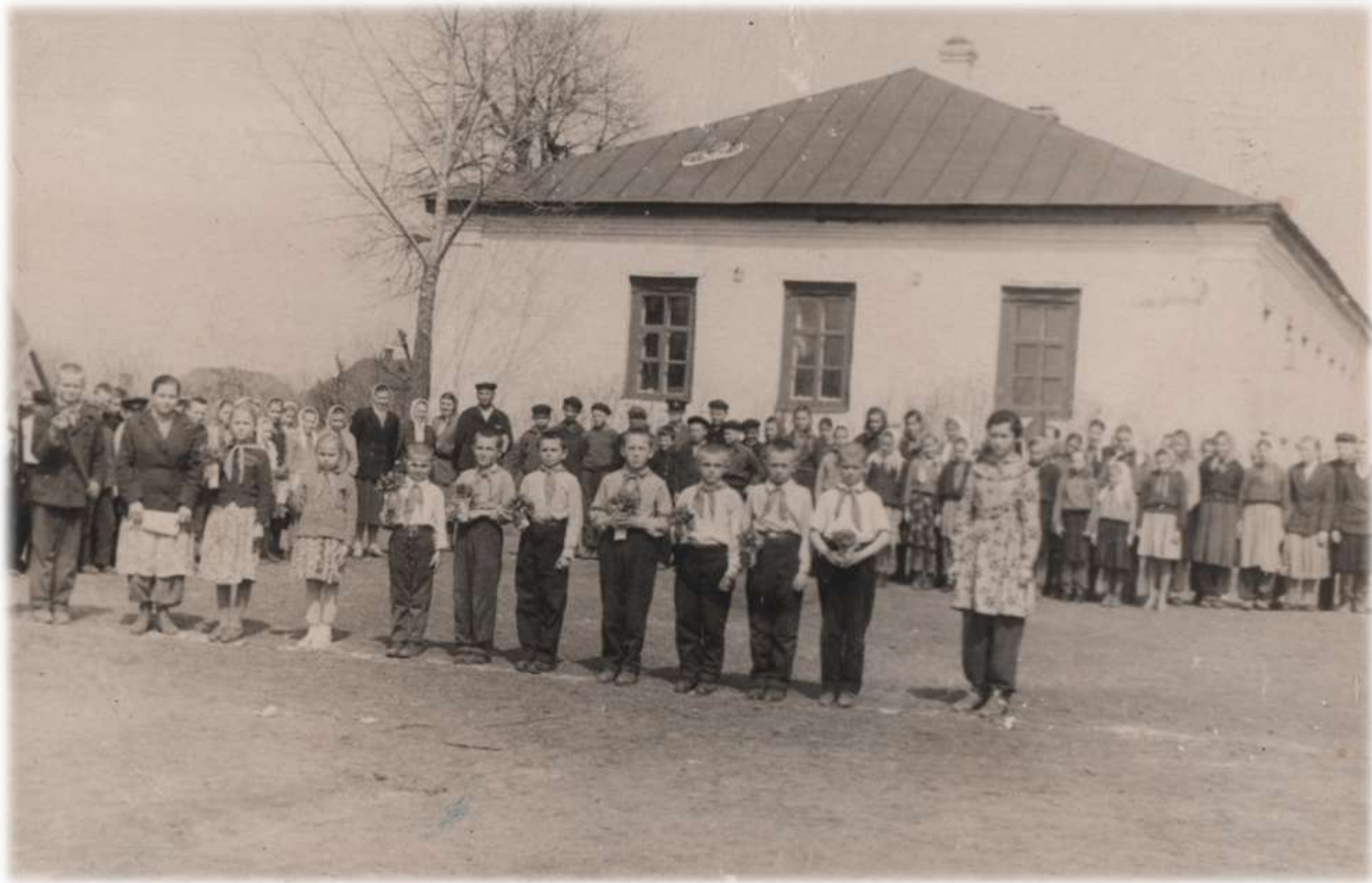
1953 р. Посвята в піонери