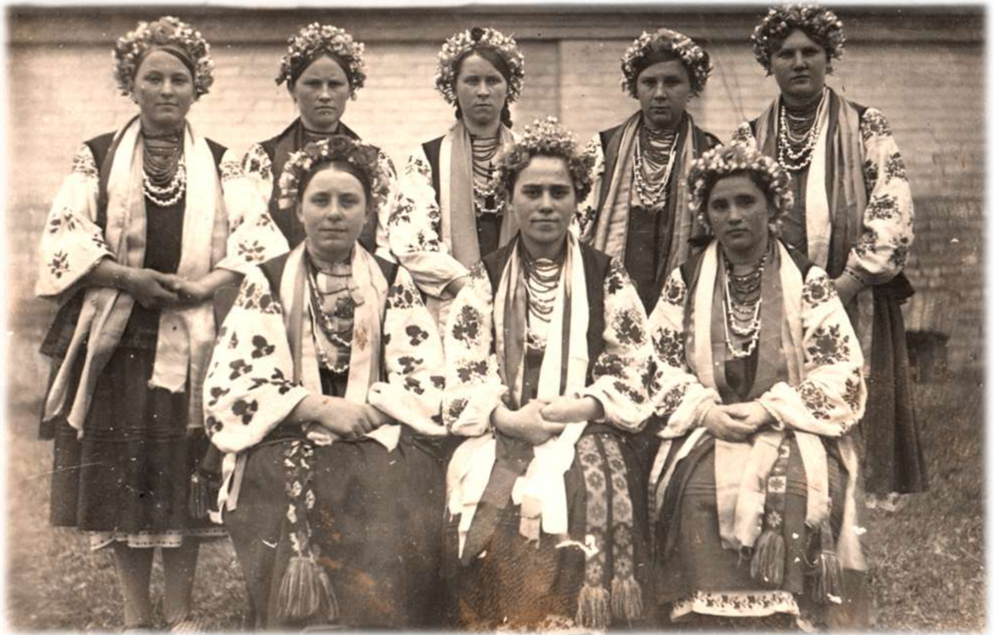
1 травня 1941 р. Хорова група музично-співочого гуртка.