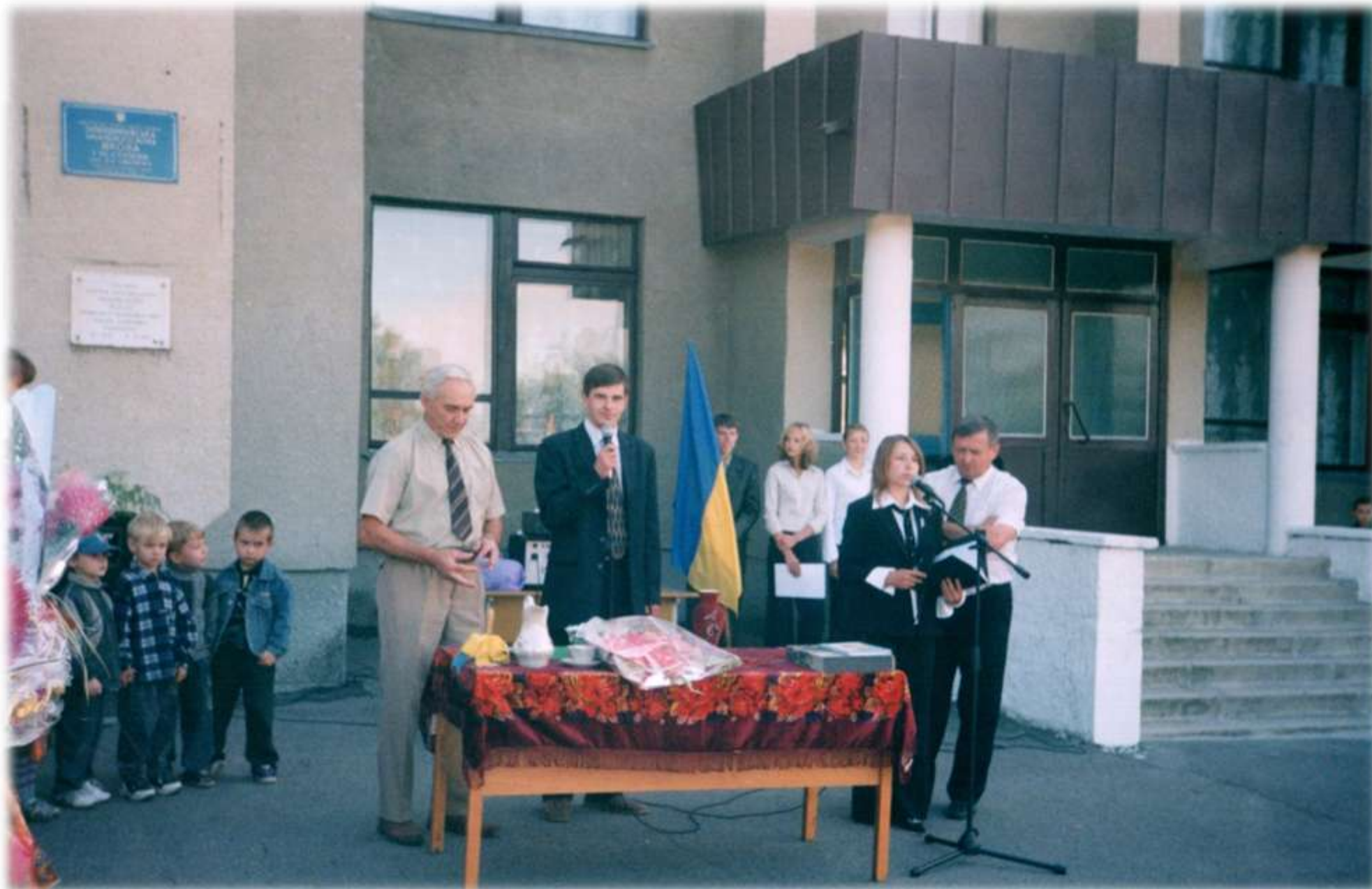
2008 р. Свято Першого дзвінка