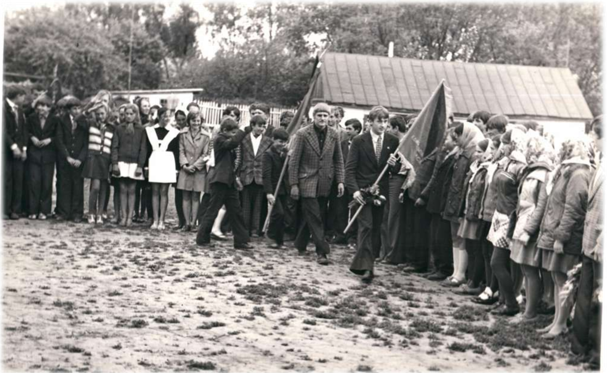
1977 р. Урочиста лінійка, присвячена святу Останнього дзвінка