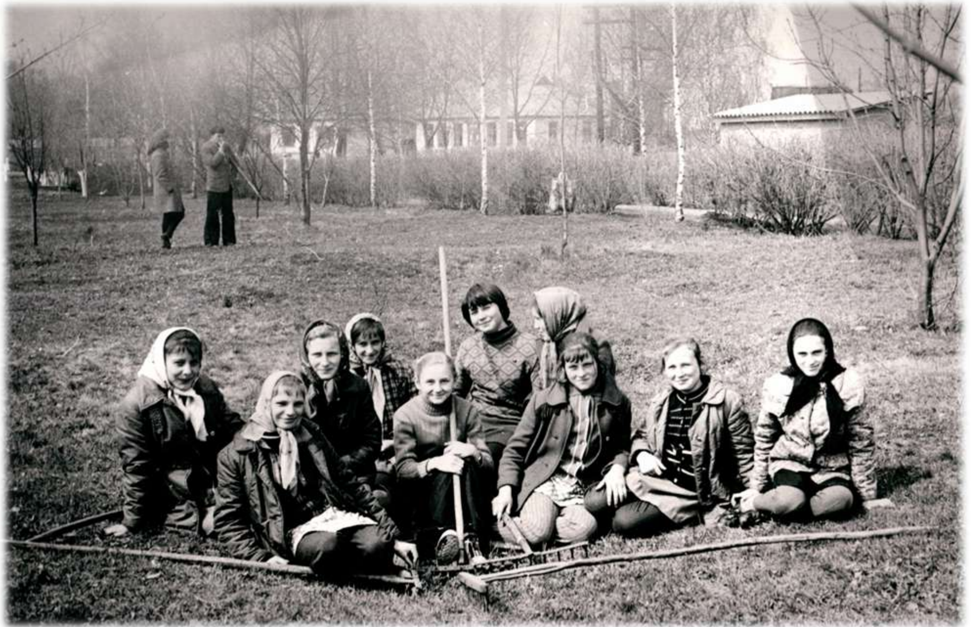
1977 р. Учні 9 класу прибирають територію сільського парку