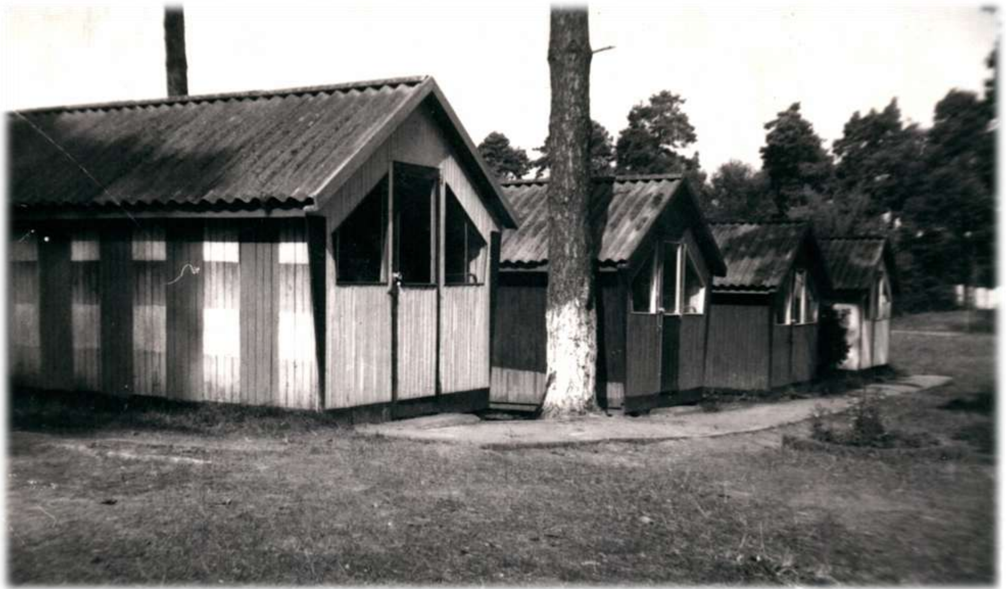
1976 р. Шкільна кролеферма