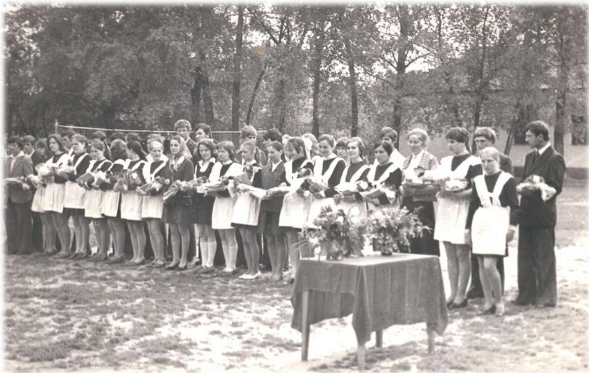
1977 р. Свято Першого дзвінка