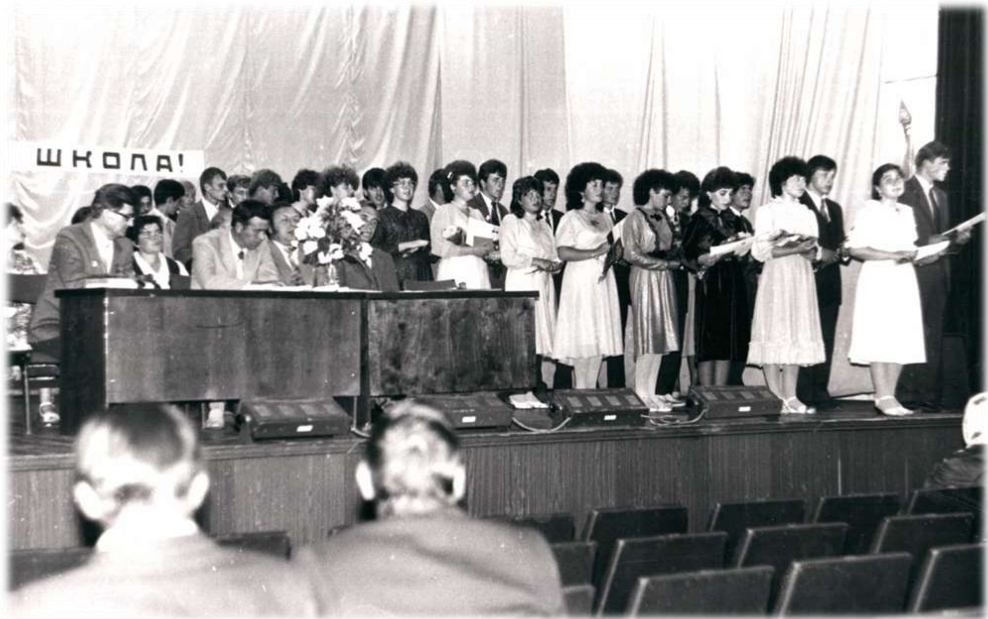
1988 р. Випускники на сцені будинку культури