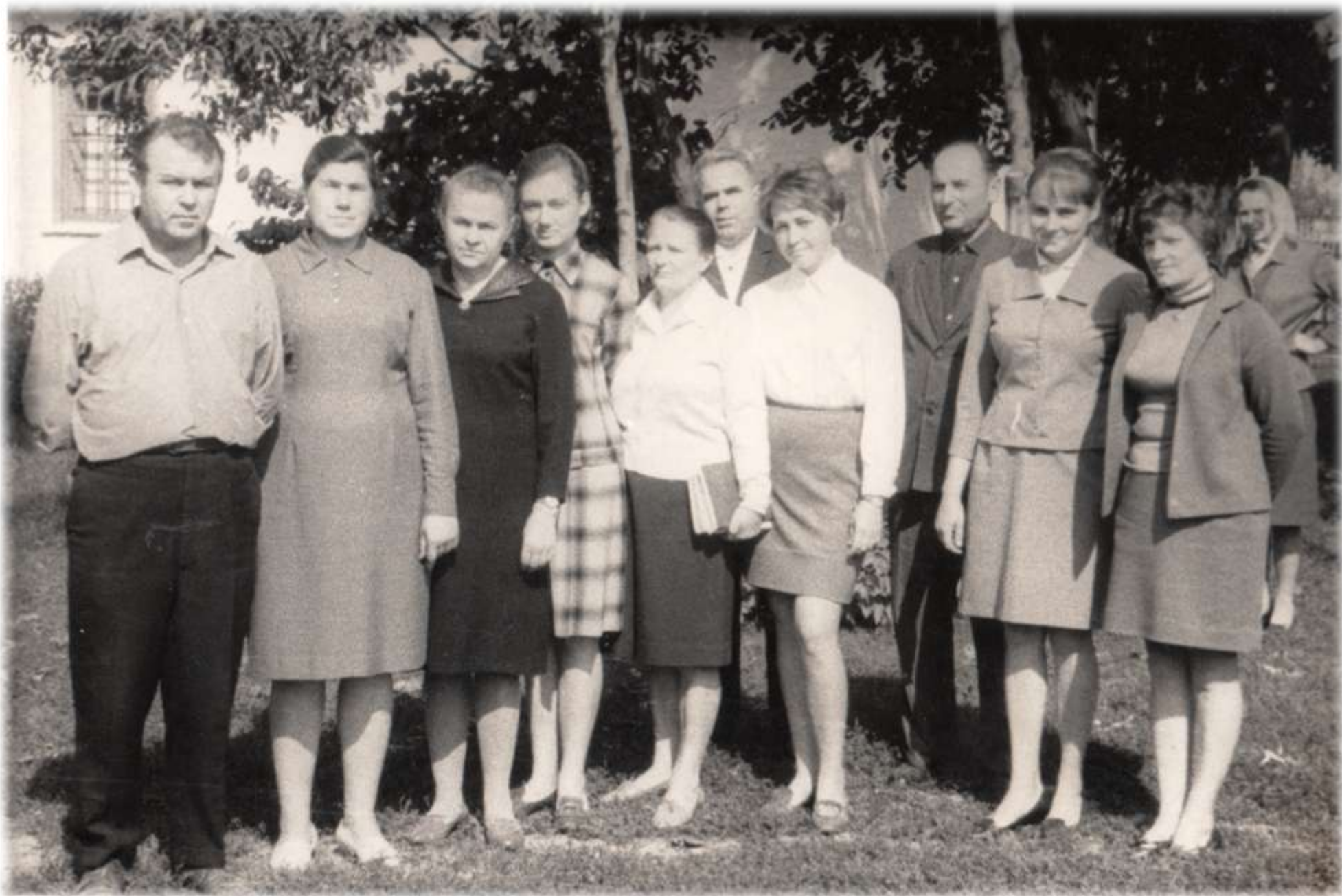
1970 р. Педагогічний колектив школи