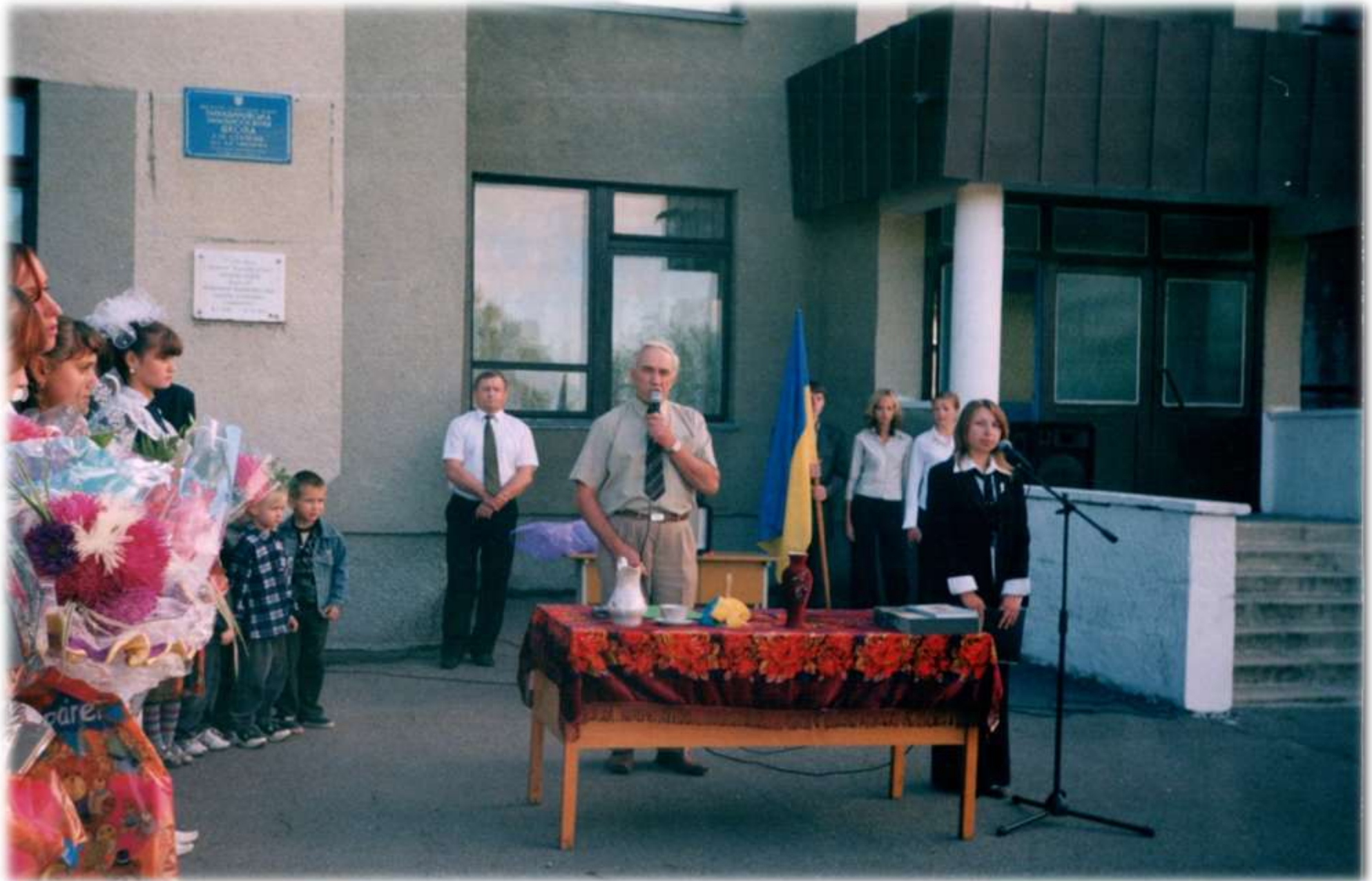
2006 р. Свято Отаннього дзвінка