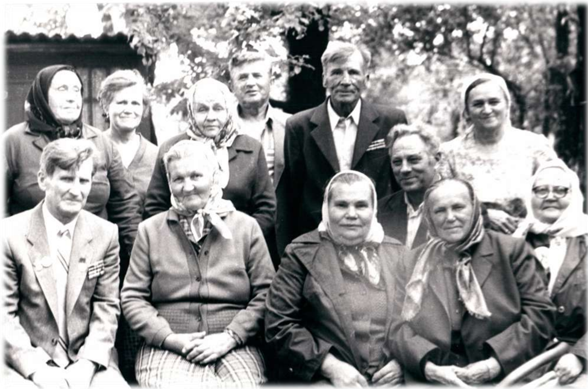
1988 р. Зустріч випускників 1938 року