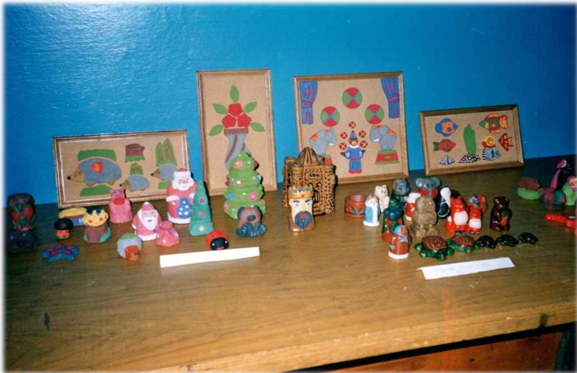
2010 р. Виставка учнівських творів