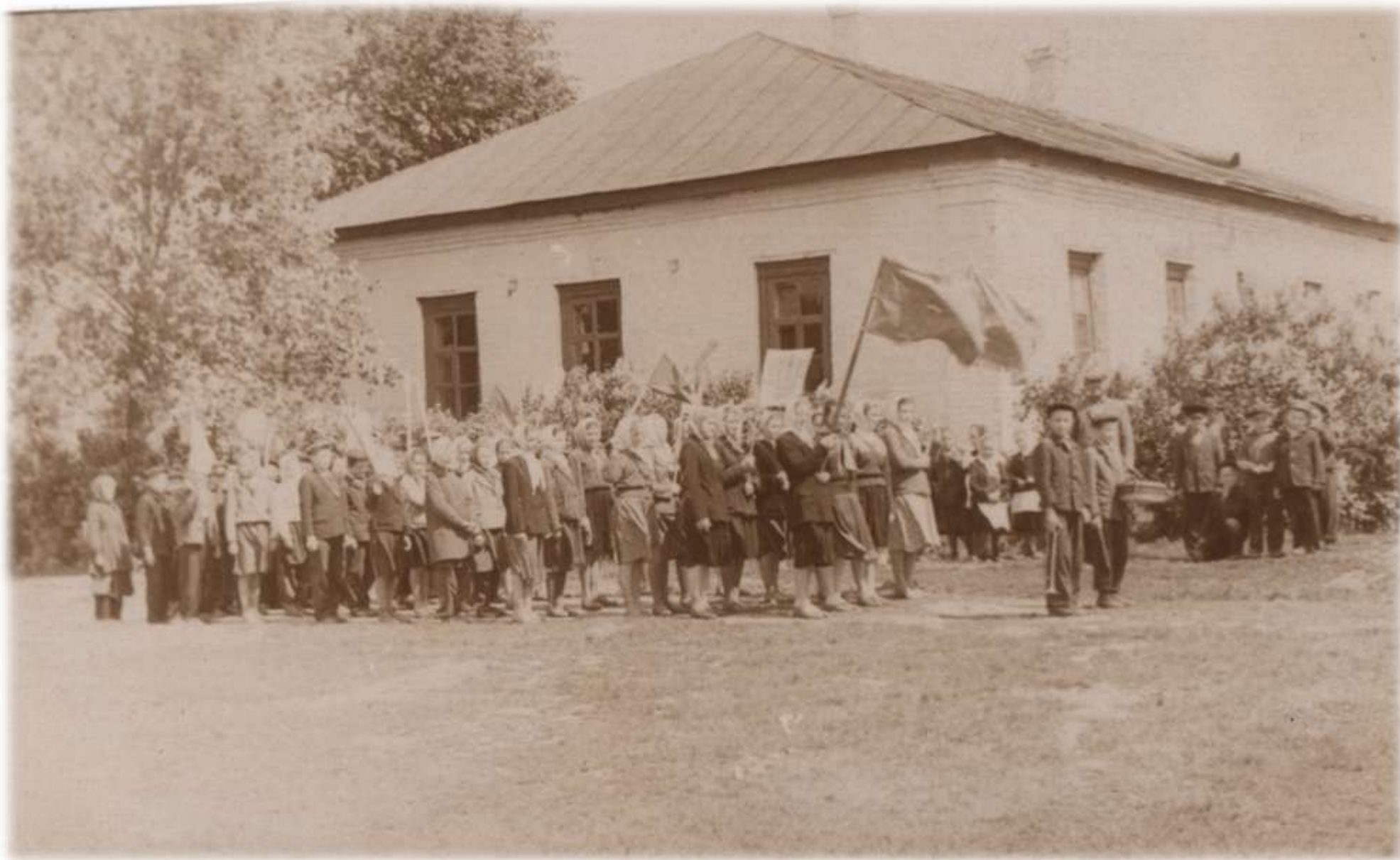
1962 р. Піонери на марші. На задньому плані будівля школи