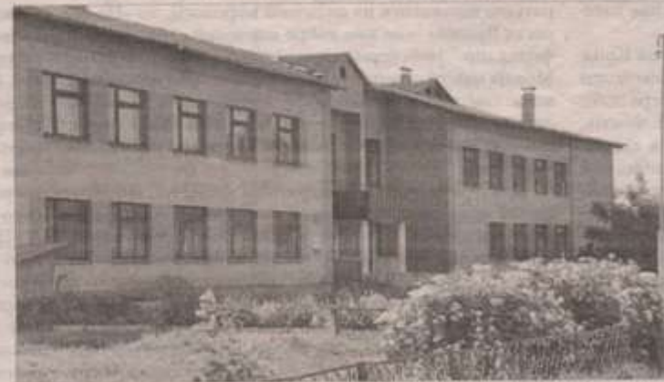
Тарандинцівська школа ім. Василя Симоненка

1 листопада 2012 р. Газета «Літературна Україна», №42 (5471)