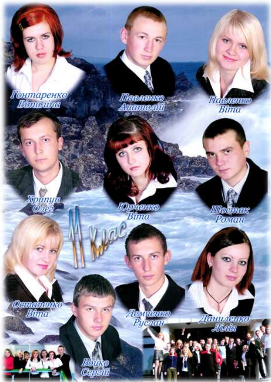
2005 р. Випускники школи