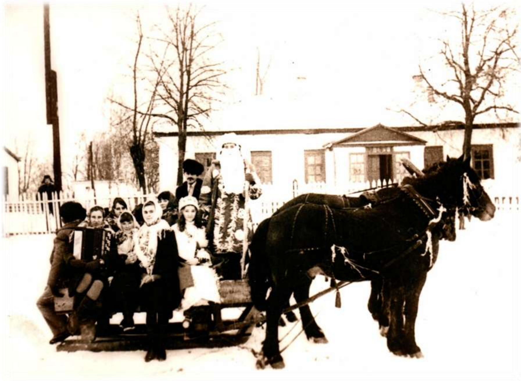
1992 р. Щедрівка