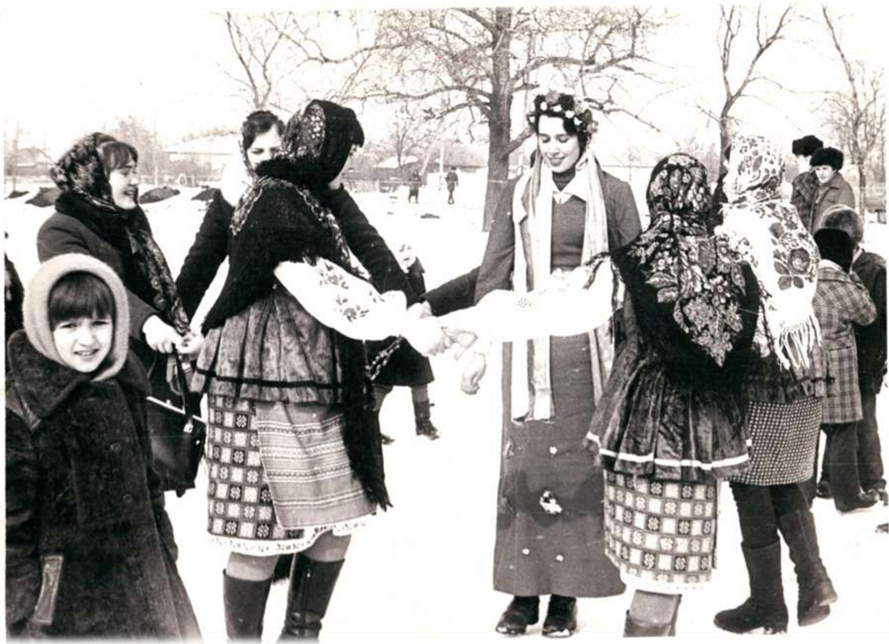
1992 р. Щедрівка