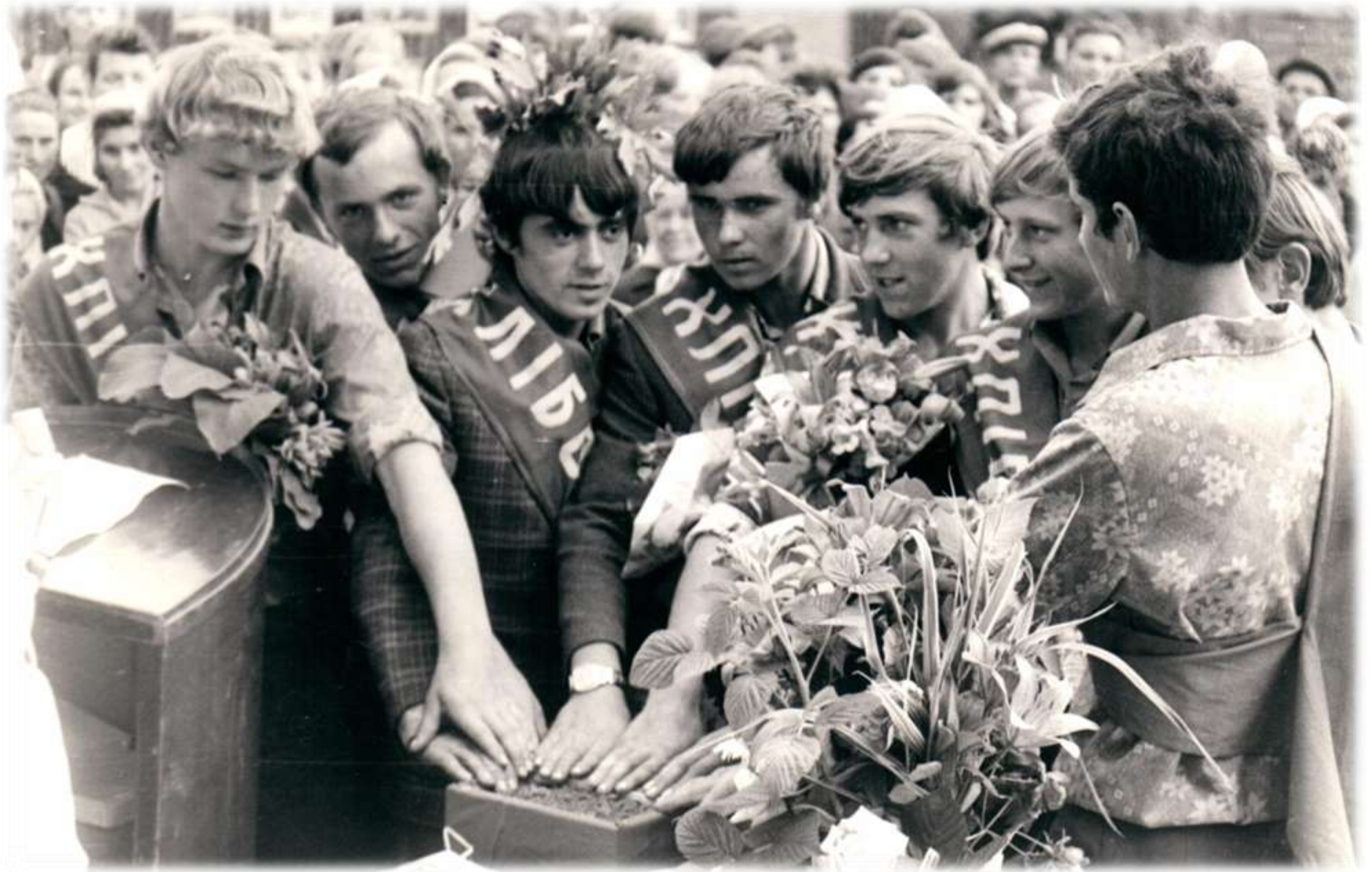
1977 р. Посвята випускників школи в хлібороби «Клянемося! Ми продовжимо справу батьків і станемо справжніми хліборобами»