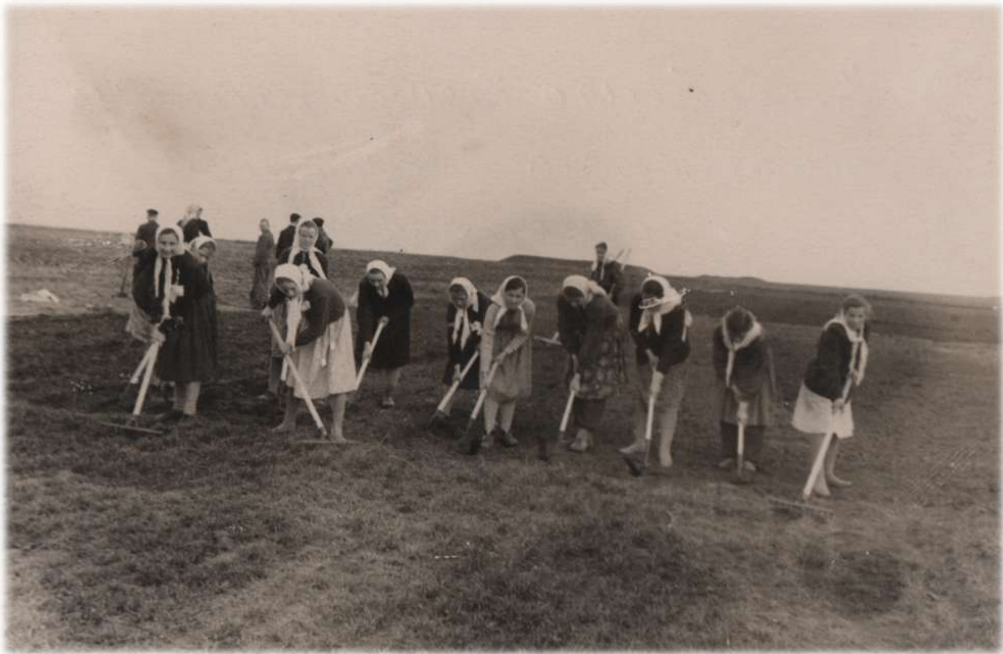
1961 р. Виробнича бригада школи працює на дослідних ділянках