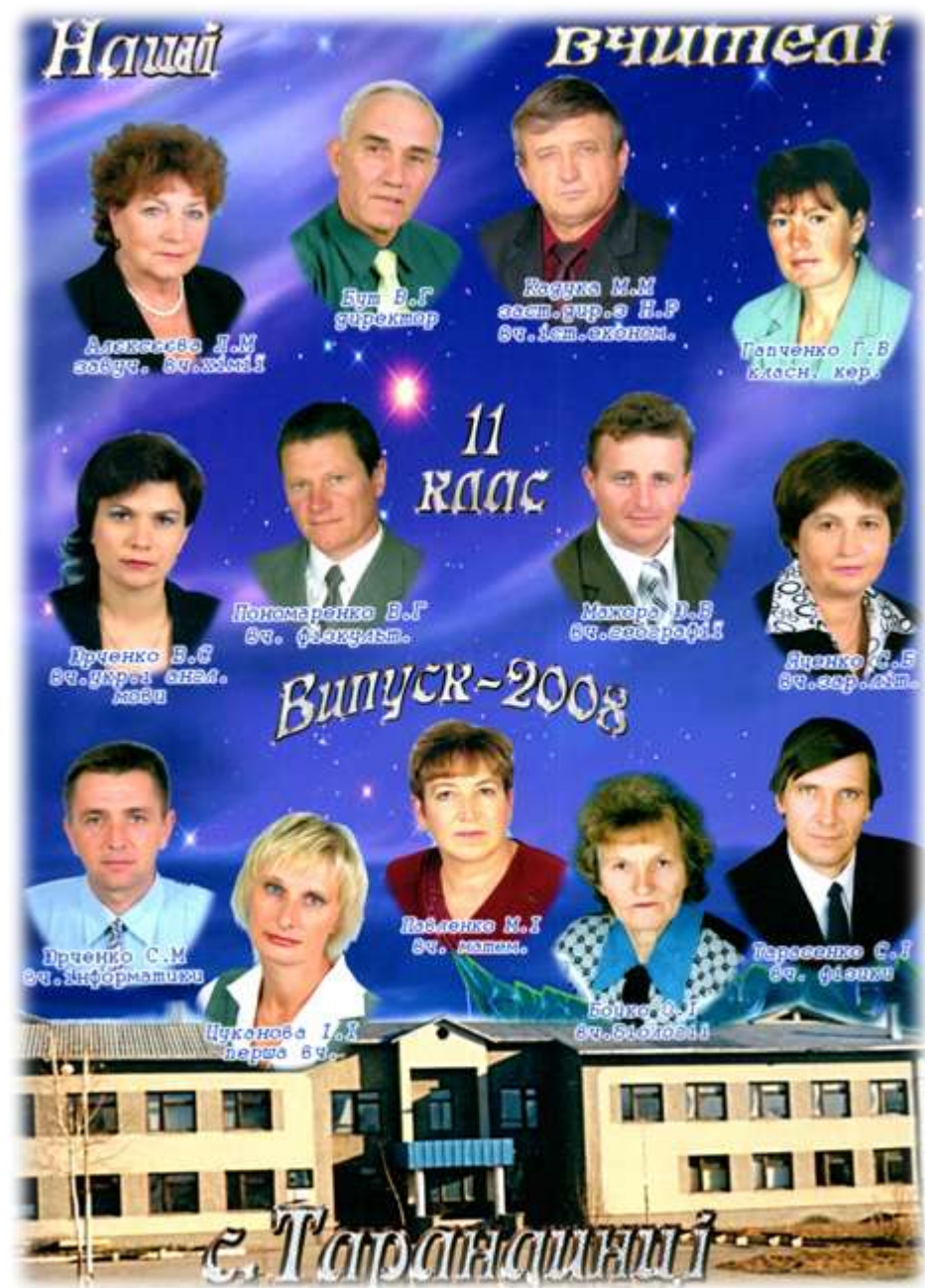
2008 р. Педагогічний колектив школи