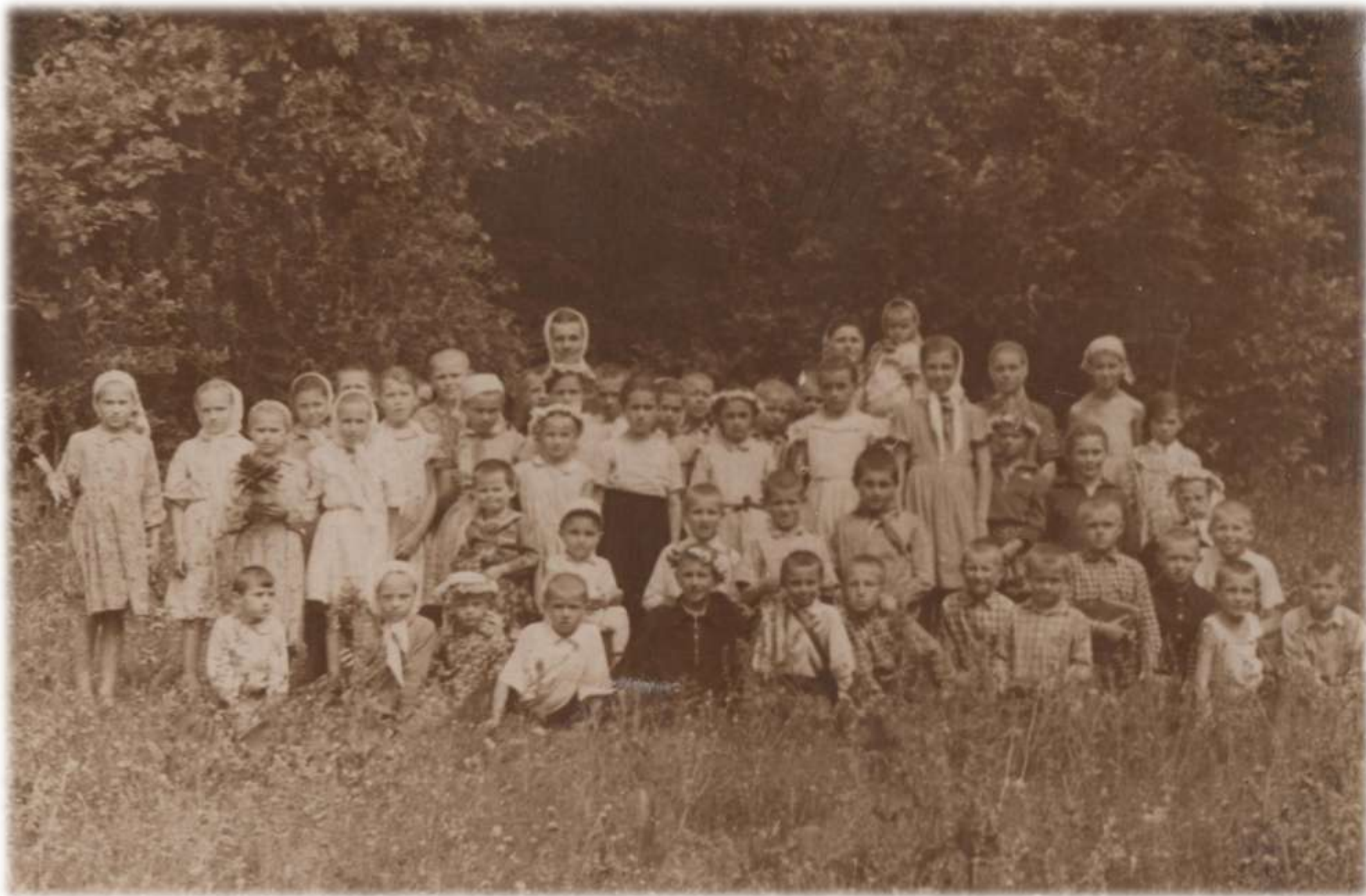
1960 р. Екскурсія на природу