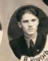
В. Корин В.