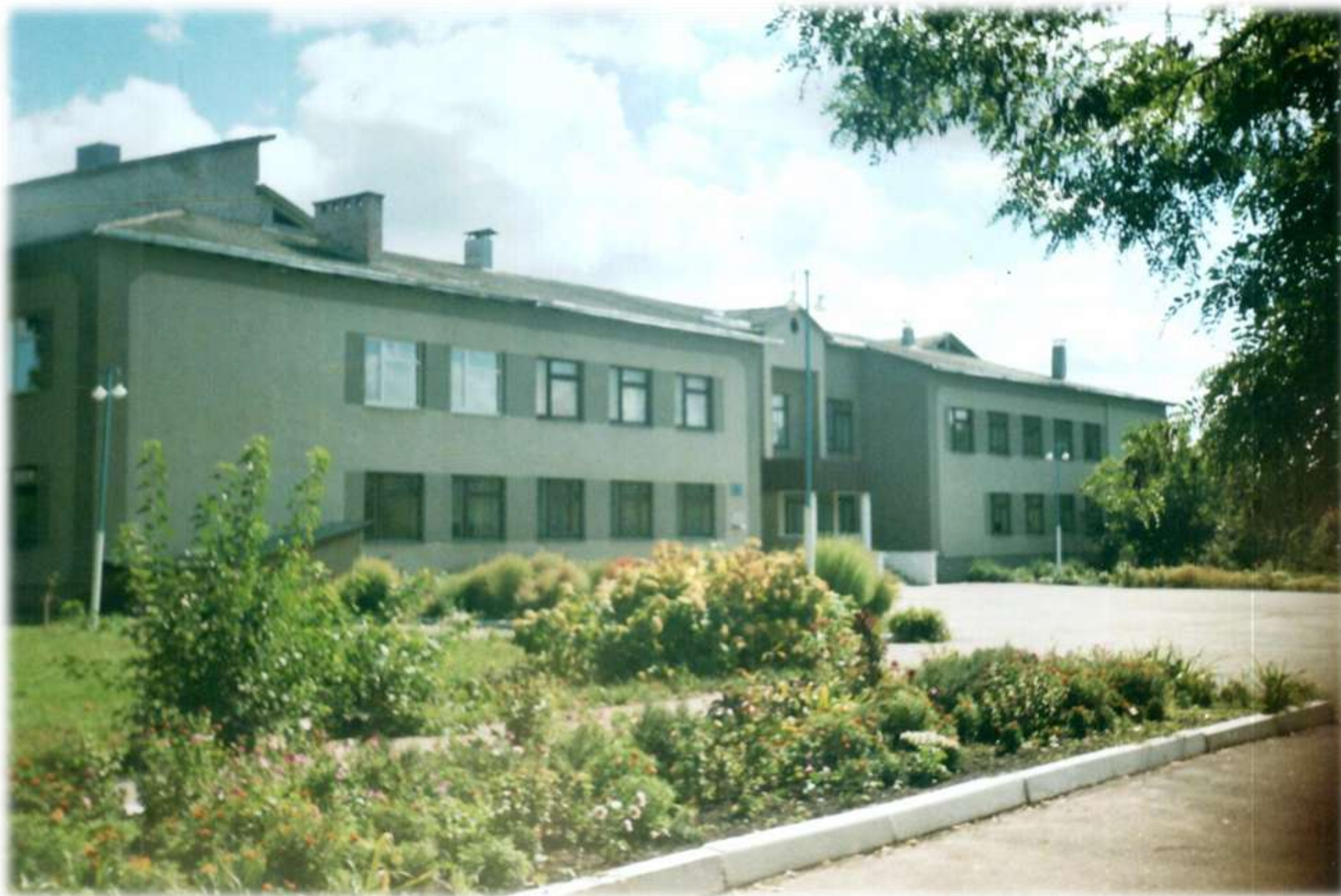
1995 р. Тарандицівська школа імені Василя Андрійовича Симоненка