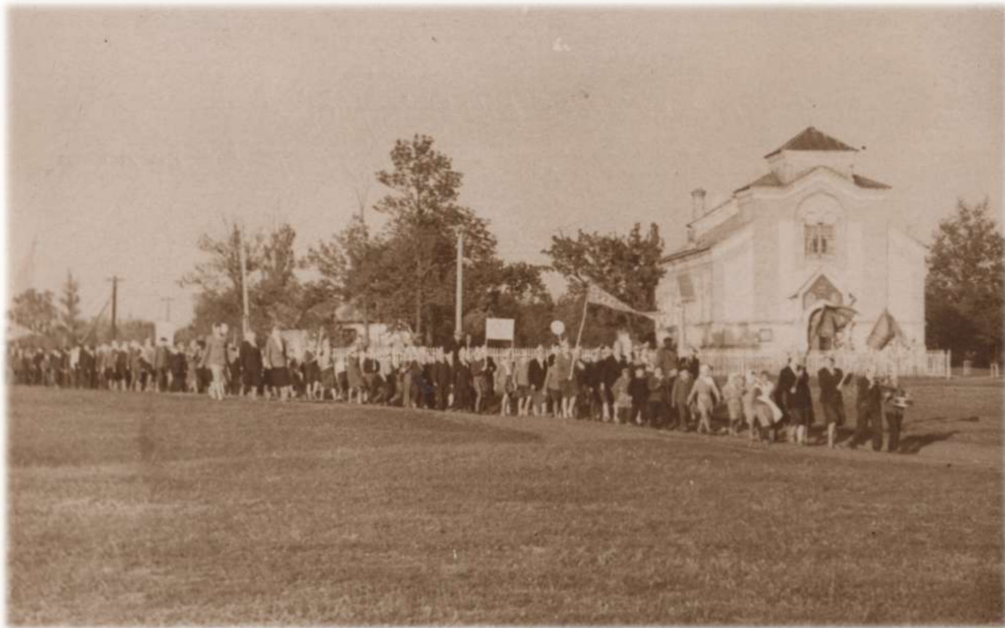
1963 р. Піонери крокують на піонерське вознище. На задньому плані Святогеоргіївська церква