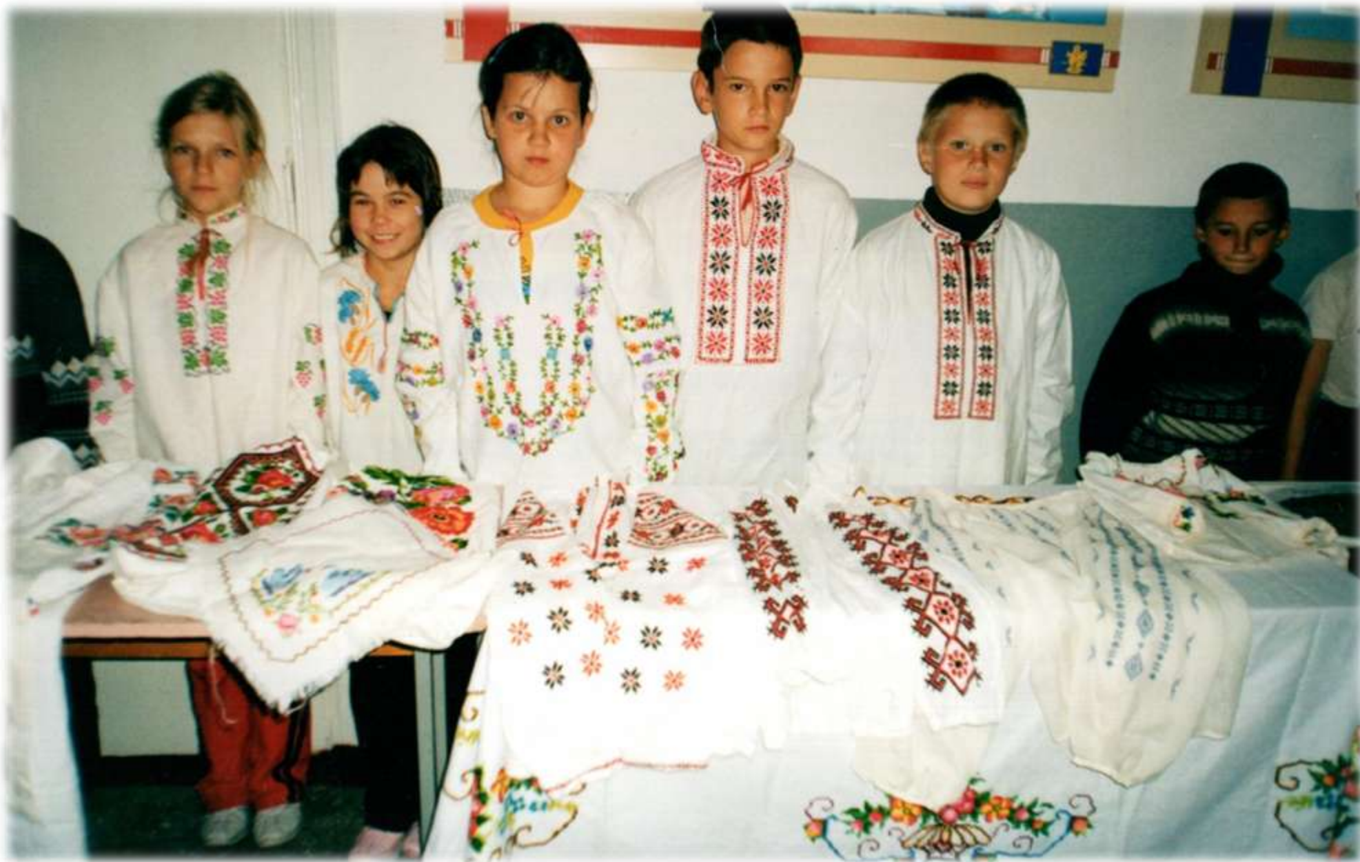
2006 р. Презентація вишивок