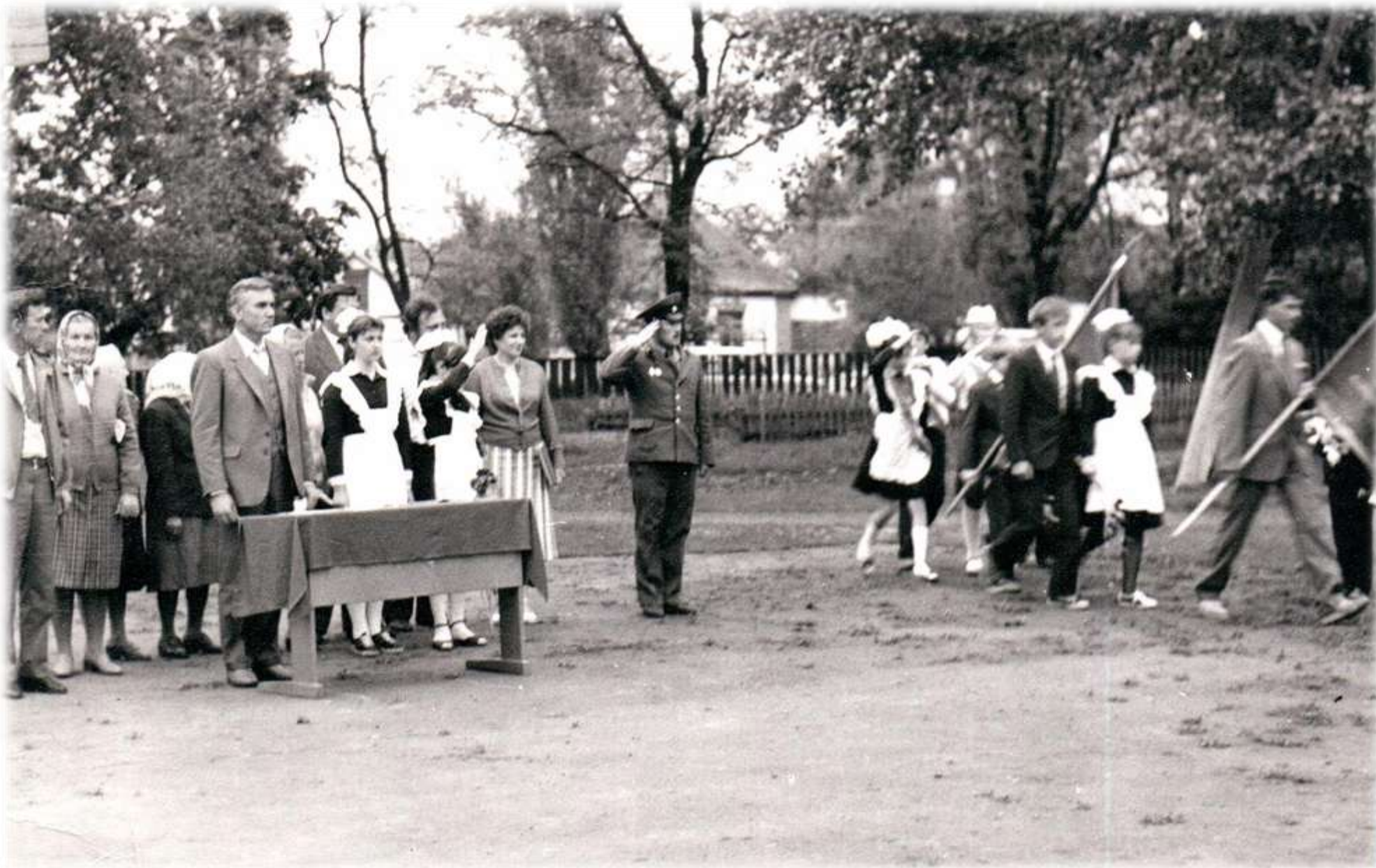
1988 р. Останній дзвінок