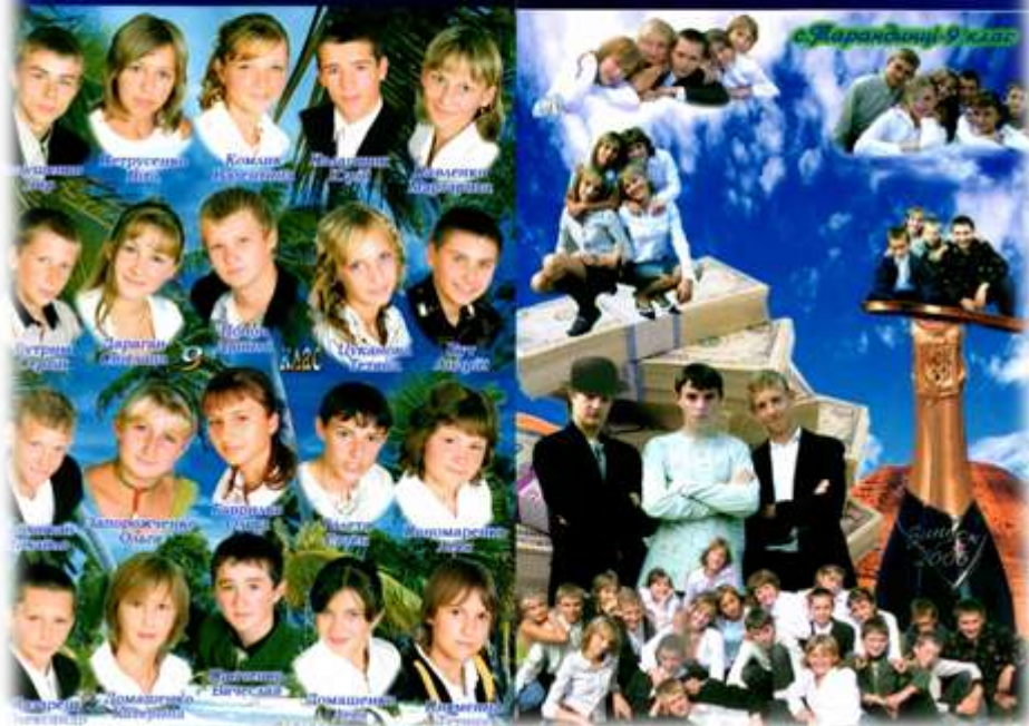
2006 р. Випускники школи