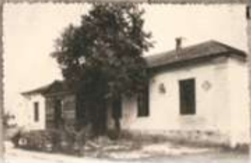
Школа в Лазірському р-ні